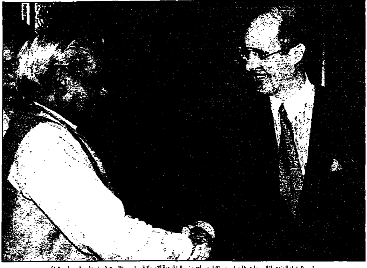
نيودلهي - من جون تشالز: اسلام اباد- رويترز: بدأ نائب وزير الخارجية الامريكية سترووب تالوت أمس الاثنين مسامحة للخطر انتشار الاسلحة النووية.